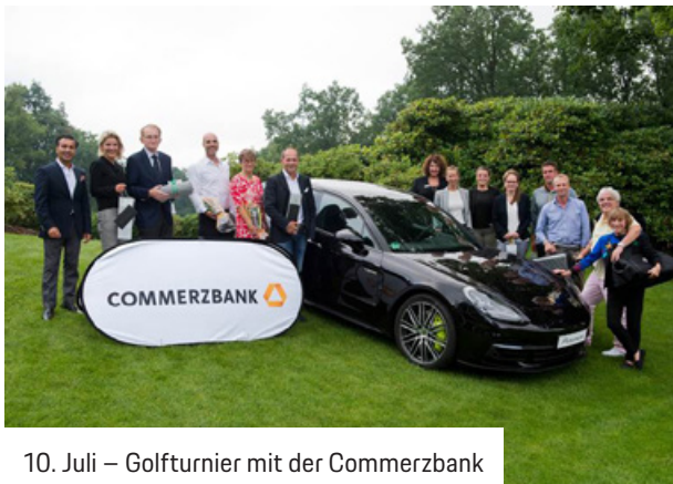
10. Juli – Golfturnier mit der Commerzbank