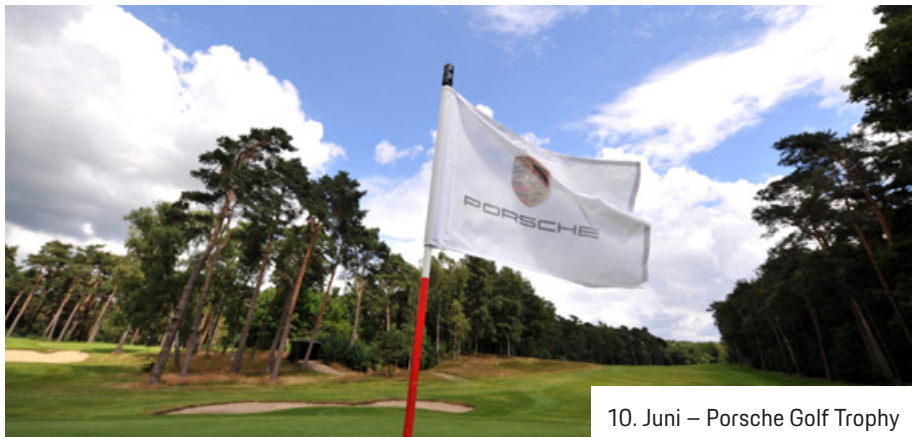
10. Juni – Porsche Golf Trophy