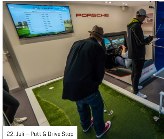
22. Juli – Putt & Drive Stop