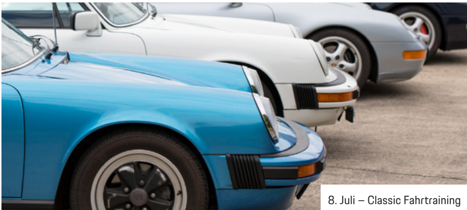
8. Juli – Classic Fahrtraining