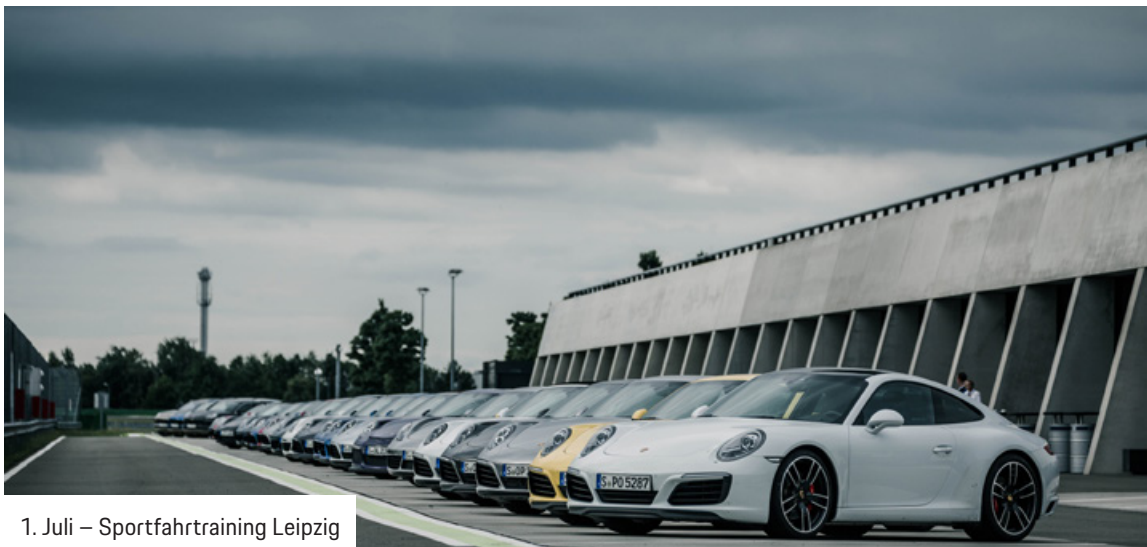
1. Juli – Sportfahrtraining Leipzig