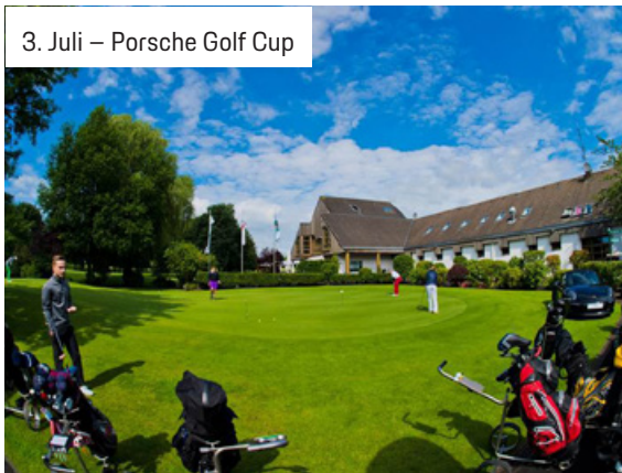
3. Juli – Porsche Golf Cup