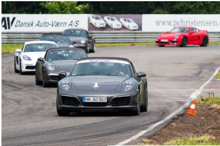
9. Juni – Individualcoaching Padborg