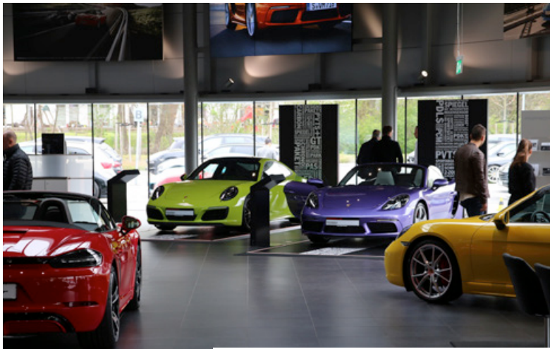
6. Mai – Exclusive und Tequipment Aktionstag