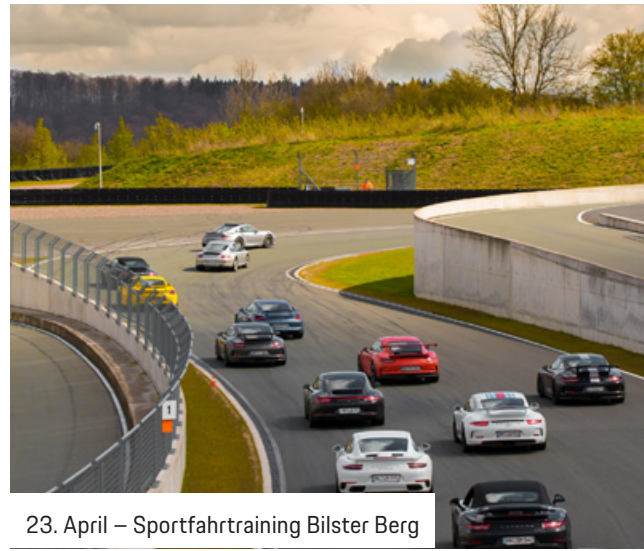
23. April – Sportfahrtraining Bilster Berg